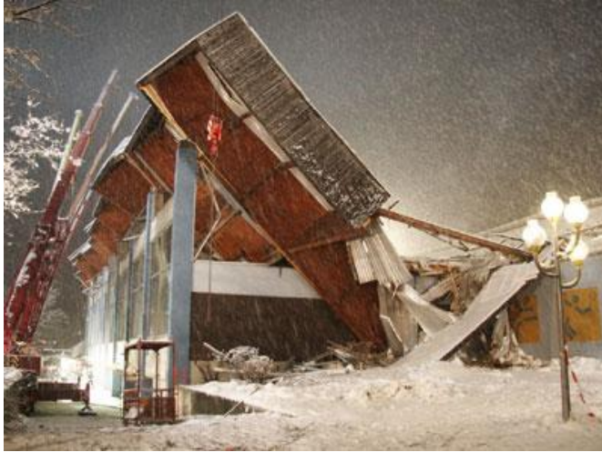
Bilder 5 und 6: Lage der Binder nach dem Versagen

zerbrochen und auf die Eisfläche aufgeschlagen. Hieraus ist zu schließen, dass erst der Bruch eines Binders in einer Art Kettenreaktion zum Einsturz des gesamten Dachtragwerkes geführt hat. Es konnte auch nicht geklärt werden, ob ein Knall, der ca. 30 Minuten vor dem Einsturz von vielen Zeugen wahrgenommen wurde, in einem ursächlichen Zusammenhang mit dem Schadensereignis stand.