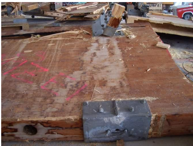
Bild 8: Aufgebohrte Gurte, um die Regenfallrohre unsichtbar im Innern der Binder zu führen

Die sich aus dem Schließen der Fassadenflächen ergebenden, möglichen Änderungen in bauphysikalischer Hinsicht (Feuchtehaushalt, Kondensat, usw.) wurden nicht untersucht. Auch die Nutzung als Eissporthalle wurde bei der Errichtung nicht beachtet. Allerdings war zum damaligen Zeitpunkt noch nicht allgemein bekannt, dass die Kältestrahlung der Eisfläche zu einem Abkühlen sämtlicher Innenflächen der Halle mit der Gefahr einer Kondenswasserbildung führt.