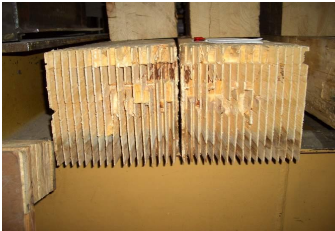
Bild 7: Keilzinkenverbindung eines Untergurtes (auseinandergeklappt) - es ist deutlich zu erkennen, dass das untere Viertel der Leimflächen ohne Wirkung war

Binderschüsse mit Hilfe von Gurten. Bei einer Verleimung am Stück wären die Schwachpunkte „General-Stöße“ vermieden worden.