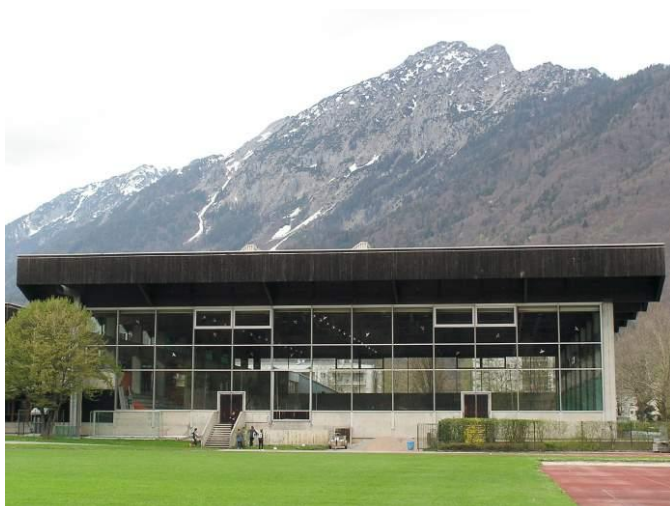
Bild 1: Eissporthalle in Bad Reichenhall, Ansicht der schmalen Front

Bei dem Einsturz der Anfang der 70-er Jahre neu errichteten Eissporthalle in Bad Reichenhall im Januar 2006 handelt es sich um das spektakulärste und auch folgenreichste Versagens-Ereignis eines Bauwerkes in Deutschland in den letzten Jahrzehnten.