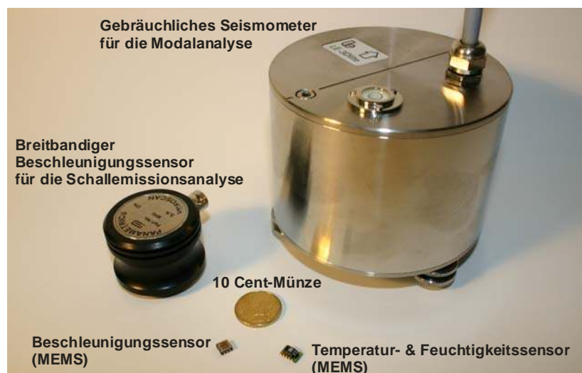
Abbildung 3: Konventionelle und MEMS-basierte Sensorik für das Bauwerksmonitoring

Eine wesentliche Weiterentwicklung im Hinblick auf geeignete Sensorik stellen MEMS-Sensoren dar. MEMS sind mikroelektromechanische Systeme, bei denen elektrische und mechanische Komponenten auf kleinen Chips integriert werden [War2005], [Zho2001], [Krü2005]. Bei Massenfertigung sind solche MEMS mit Preisen von wenigen Euro sehr kostengünstig, wobei sie zudem aufgrund der integrierten Signalkonditionierung sowie weiterer Elektronik einfach in die Motes integriert werden können (siehe auch Abbildung 3). Weiterhin verfügen viele MEMS-Sensoren über eine integrierte Temperaturkompensation sowie Kalibrierungsmechanismen, weshalb sich deren Anwendung recht einfach gestaltet. Ein weiterer Vorteil, der sich aus der Integration der Signalkonditionierung ergibt, ist die Optimierung hinsichtlich des Stromverbrauchs. Dieser liegt bei einigen MEMS nur bei wenigen Mikro- bzw. Milliwatt.