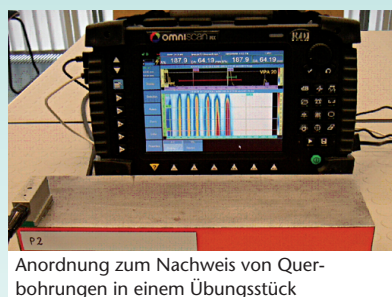
Anordnung zum Nachweis von Querbohrungen in einem Übungsstück

Kursus 21.05. – 25.05.2007 Prüfung 26.05.2007